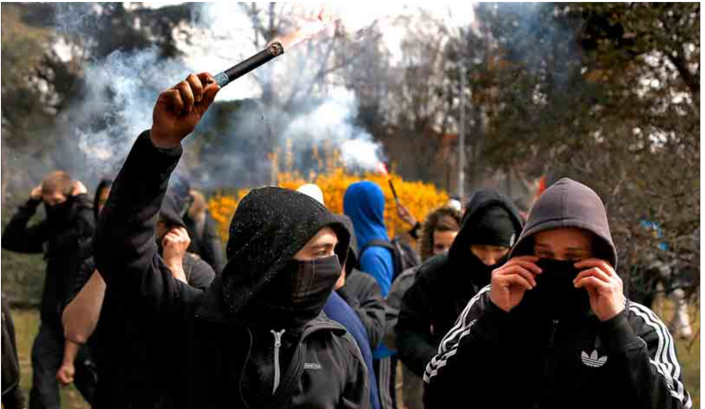
Un joven muestra una bengala, ayer, durante las protestas estudiantiles en el campus de la Universidad Complutense de Madrid.