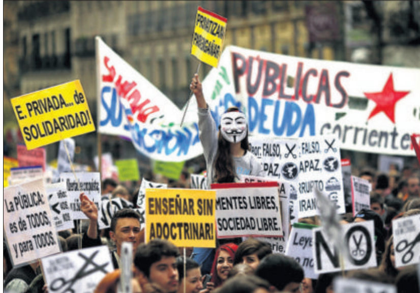
Manifestación de estudiantes en Madrid.