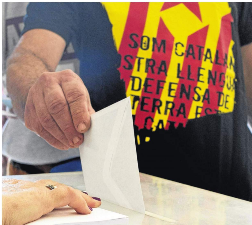
Un ciudadano deposita su voto en un colegio electoral de la localidad de Vic (Barcelona).

Para Vázquez, el sistema se está agotando, el espíritu de la transición se desmorona, las generaciones jóvenes exigen una España nueva que supere la voracidad de los partidos políticos y de los sindicatos, ade-