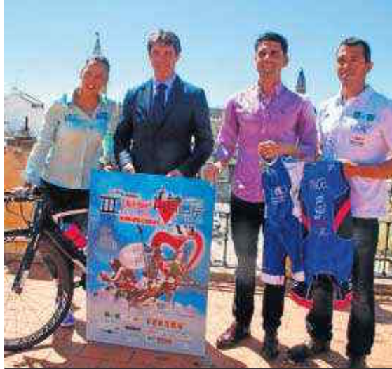
Presentación de la III edición del Half-Triatlón de Sevilla.

Se trata de una de las pruebas de este tipo que despiertan más