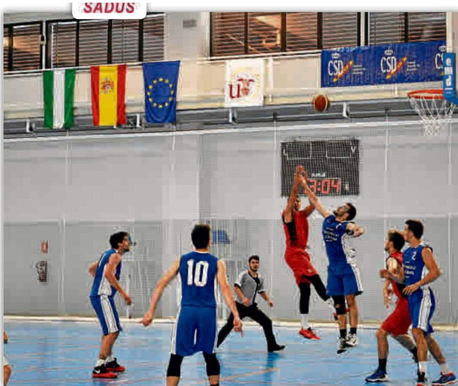
El partido tendrá lugar a las 12:30 horas en el pabellón del C.D.U. Los Bermejales.