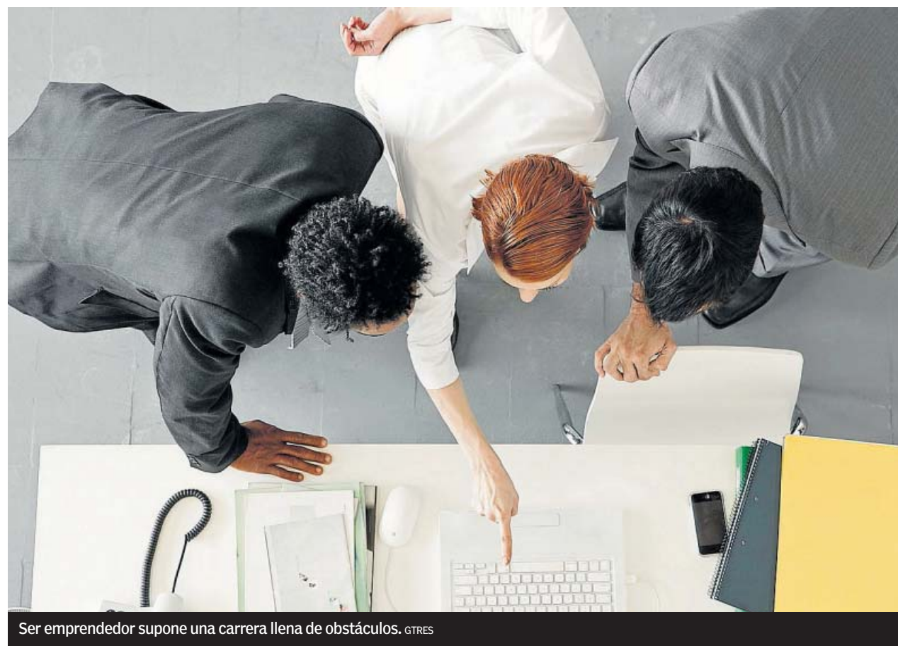
Ser emprendedor supone una carrera llena de obstáculos.

Pacto de socios. Este acuerdo refleja cómo van a ser las relaciones internas dentro de la sociedad con la finalidad de evitar futuros malentendidos y conflictos que pueden poner en riesgo la viabilidad del proyecto. El principal error es que se firma un modelo estándar, olvidando que se deberían incluir las peculiaridades propias de cada