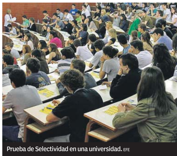
Prueba de Selectividad en una universidad.

ral» en nuestro país a pesar de la alta tasa de sexo femenino en la educación superior. La organización avala con datos esta sentencia: la tasa de empleo y los salarios son supe-