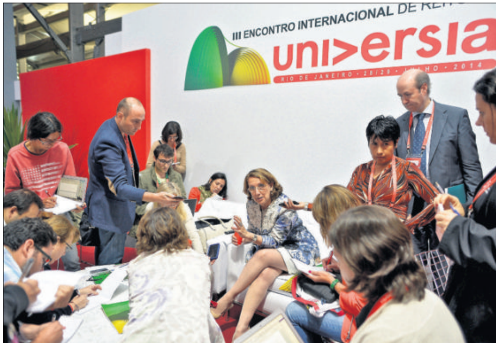
La nueva secretaria general iberoamericana, Rebeca Grynspan, atiende a los periodistas en la reunión de Universia.