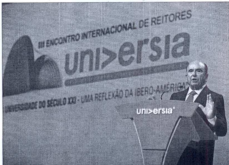
El presidente del Banco Santander, Emilio Botín, durante la inauguración del III Encuentro de Rectores Universia.

En cuanto a los objetivos de este tercer encuentro, el empresario fijó los de impulsar la modernización de la universidad; fomentar su internacionalización y el em-