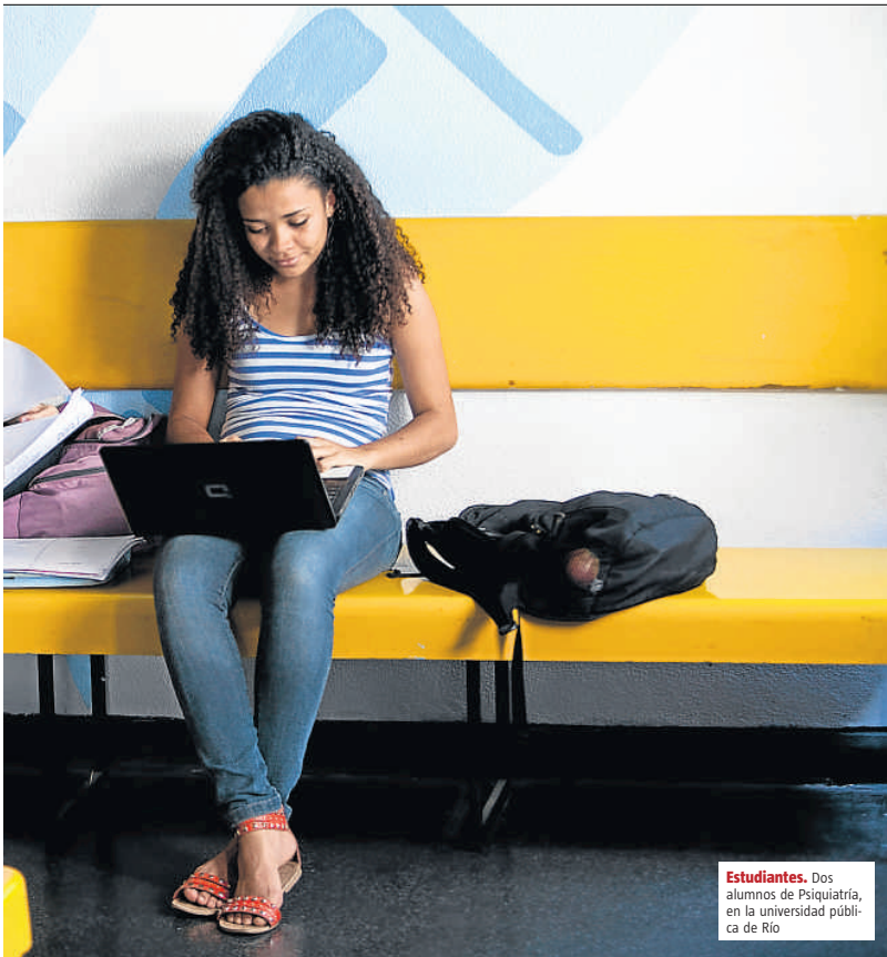
Estudiantes. Dos alumnos de Psiquiatría, en la universidad pública de Río

45.000 docentes de Brasil, China, EE.UU. y Rusia en el proyecto