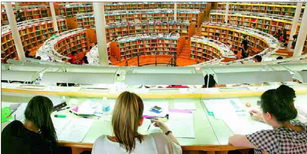
Hasta 25.000 estudiantes podrían beneficiarse del nuevo proyecto de becas en 2015-16

estudiantes, tendrán que demostrar un alto rendimiento académico.