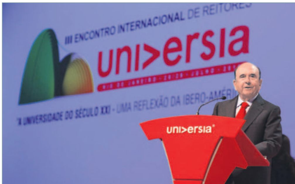
El presidente de Banco Santander y de Universia, Emilio Botín, ayer, durante su intervención en el III Encontro Internacional de Reitores.