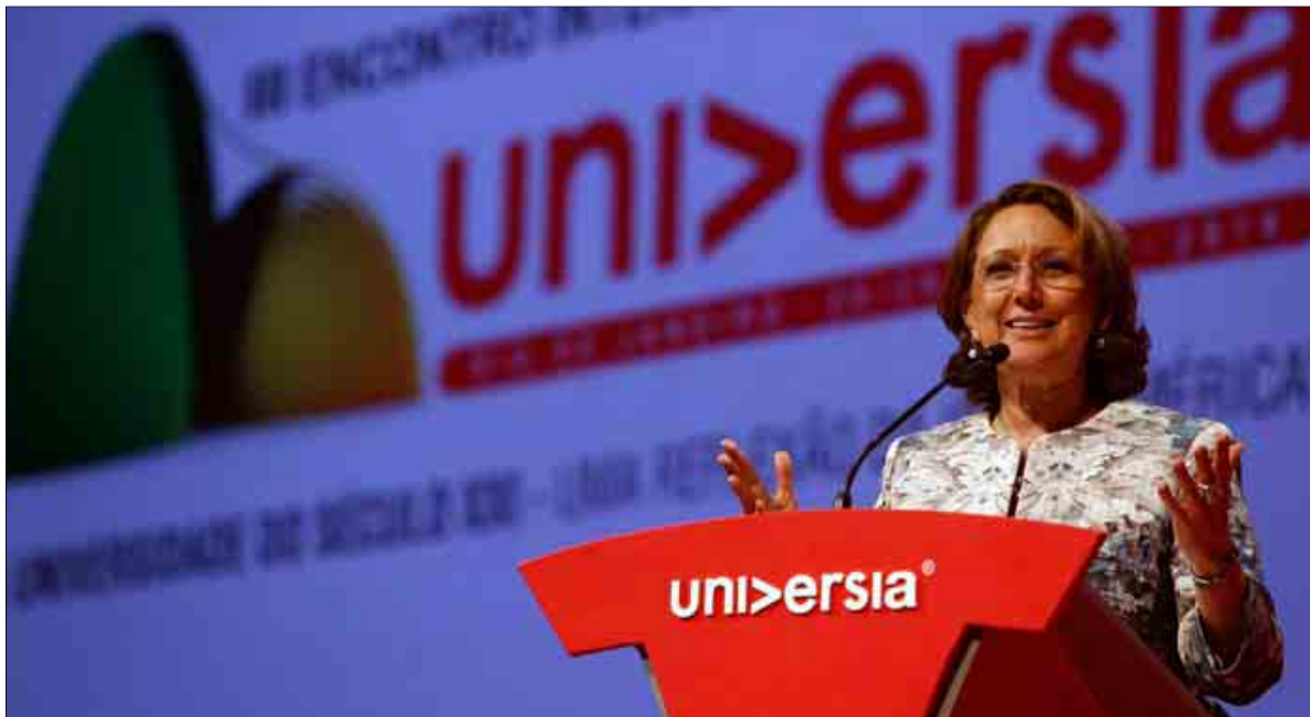
La secretaria general iberoamericana, Rebeca Grynspan, ayer en Río de Janeiro, durante su intervención en el encuentro de rectores.