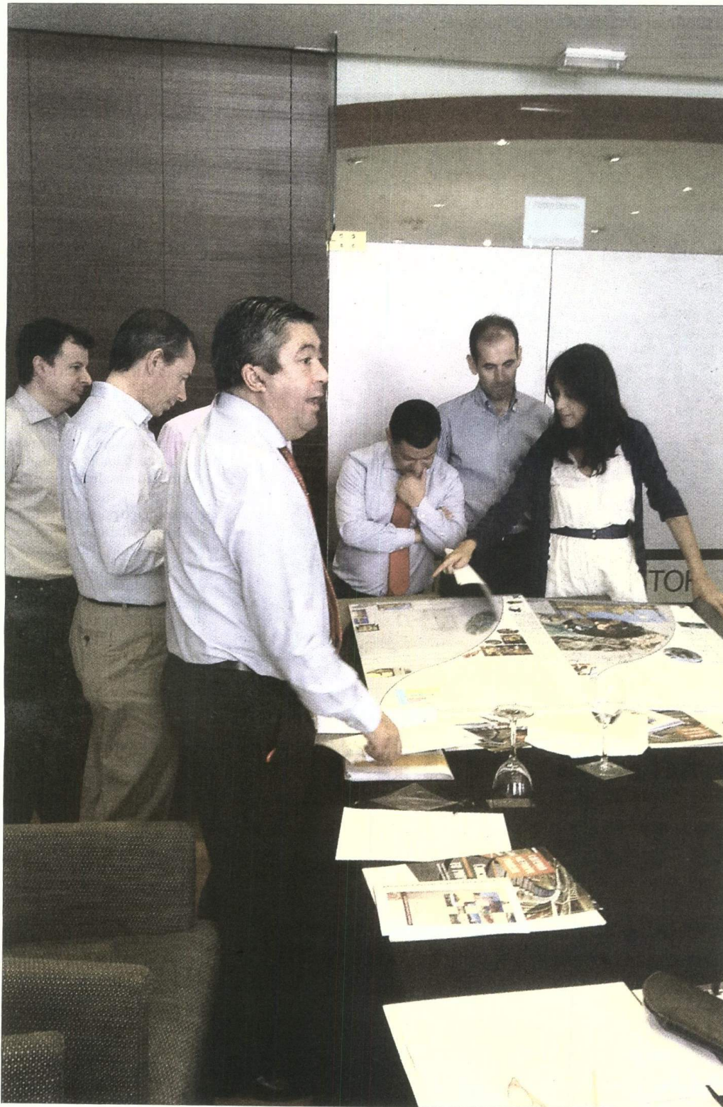
Concurso de Ideas de Metropol-Parasol. La construcción de un edificio multifuncional con helipuerto en una parcela de la Isla de la Cartuja de Sevilla y la rehabilitación del Baluarte de San Roque en la provincia de Cádiz fueron distinguidos con sendos accésit en la primera edición del Concurso de Ideas de Regeneración de Espacios y Conjuntos Urbanos Andaluces Tu proyecto-tu ciudad organizado por la Cátedra Metropol-Parasol de la Universidad de Sevilla.