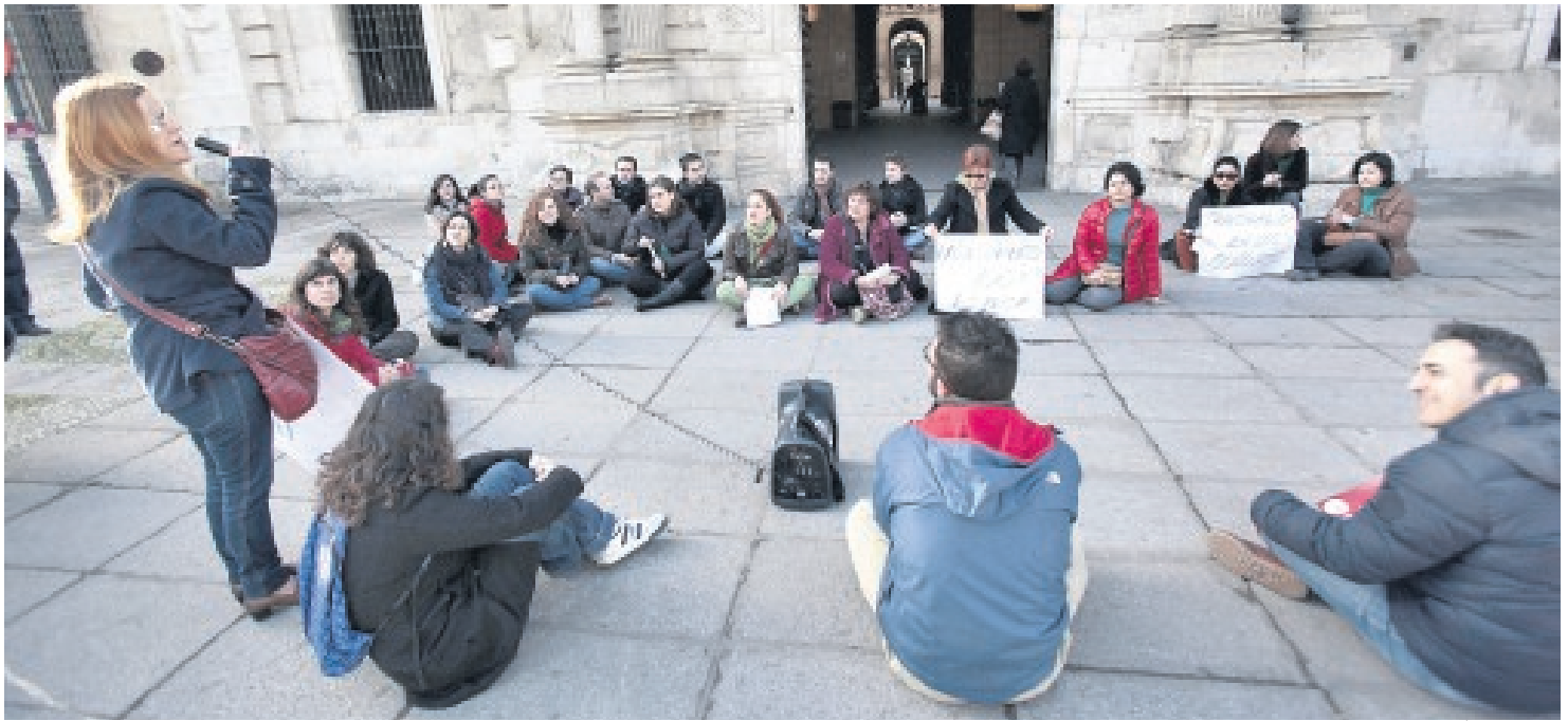
Concentración de interinos ante el Rectorado esta semana