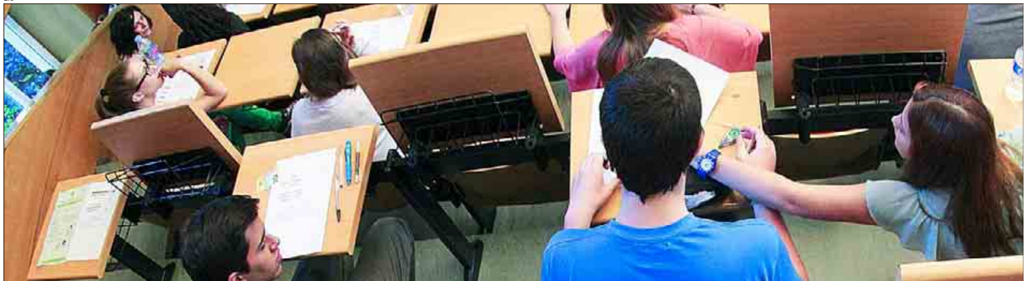
Ninguna de las 82 universidades españolas se encuentra dentro del ranking de las 150 mejores