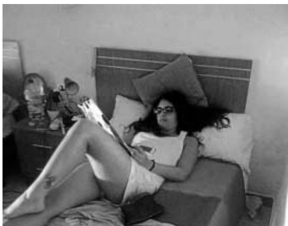
Una estudiante repasa apuntes en su habitación.