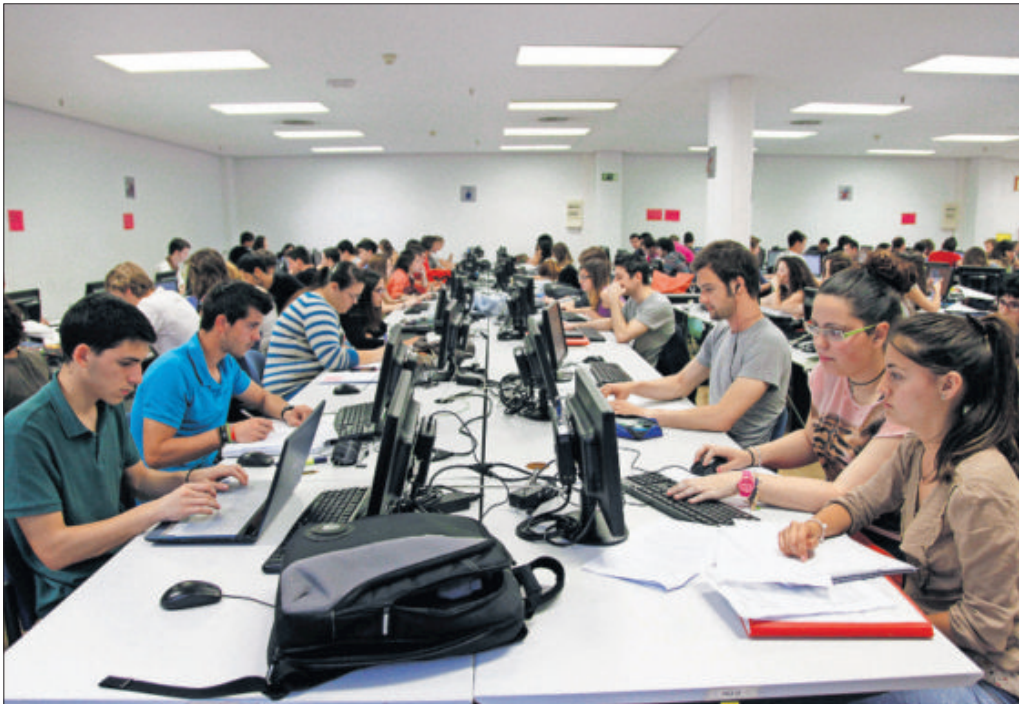
Un grupo de estudiantes prepara sus exámenes.