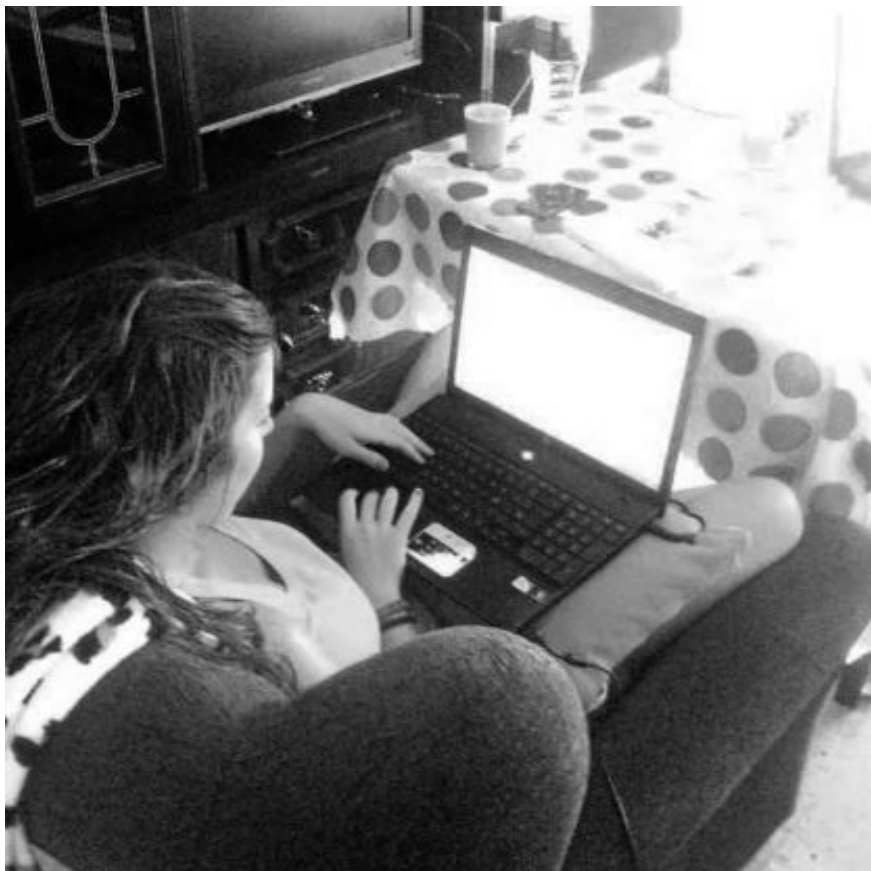
Una universitaria con su ordenador en una de las zonas comunes de un piso compartido.