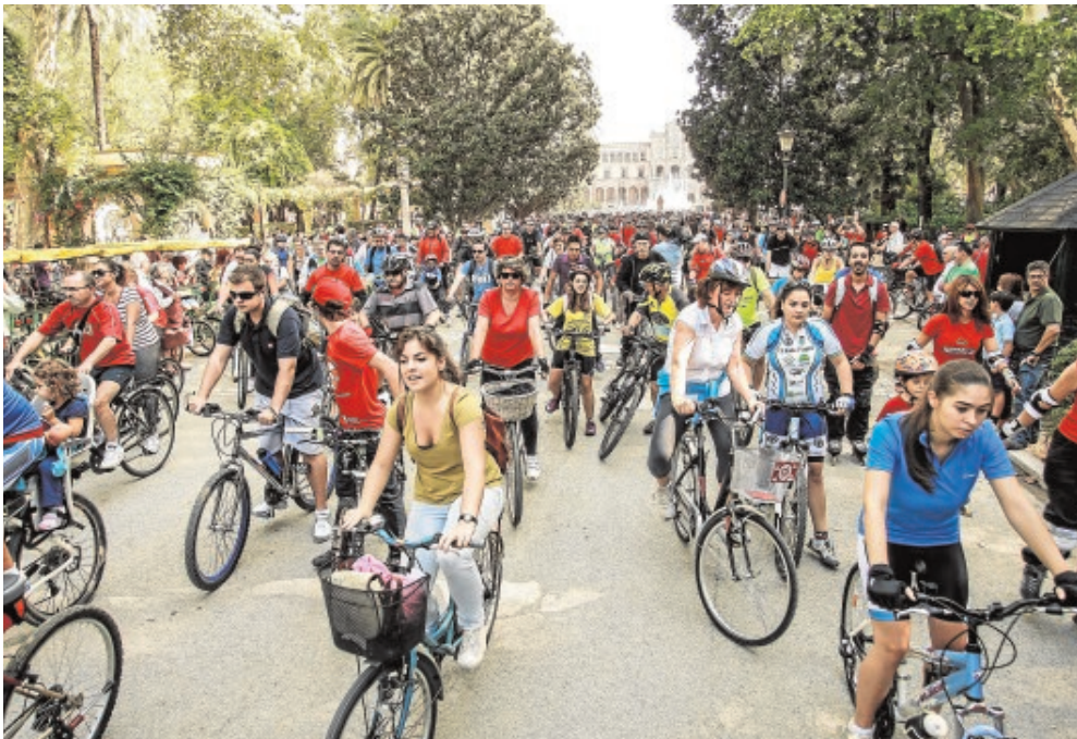
Concentración de ciclistas en el Parque de María Luisa