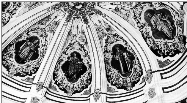
Las pinturas murales de la cúpula de la capilla de San Andrés son de autor desconocido y están datadas hacia 1740. El programa iconográfico reproduce a los cuatro evangelistas y a los cuatro Padres de la Iglesia latina. El resultado de la restauración se verá realizado con una nueva iluminación artística.