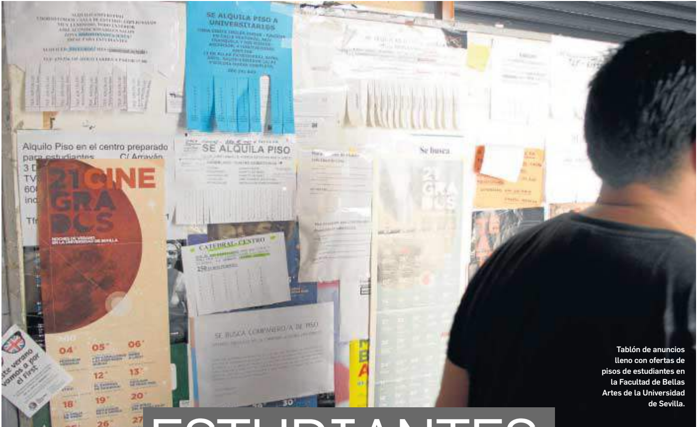
Tablón de anuncios lleno con ofertas de pisos de estudiantes en la Facultad de Bellas Artes de la Universidad de Sevilla.