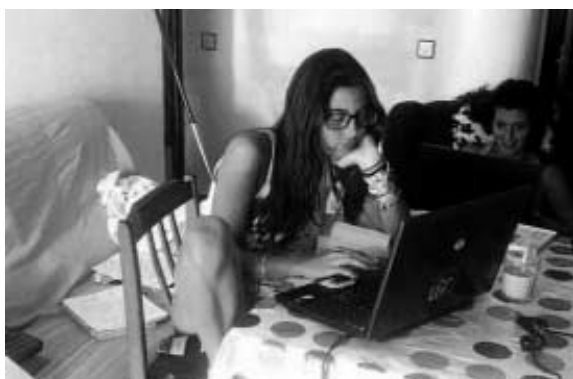
Jóvenes en el salón de una vivienda de alquiler.