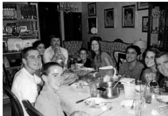
Alumnos extranjeros en una reunión con su familia de acogida.