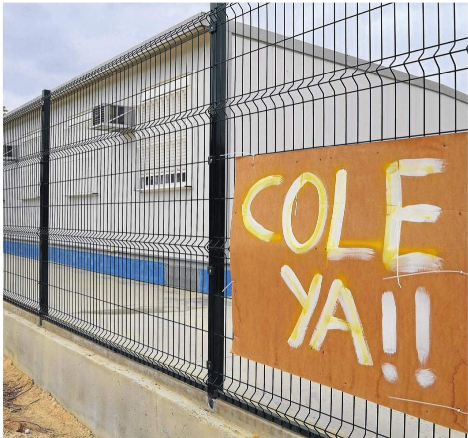
Módulo prefabricado destinado a aula escolar en un centro educativo de Sevilla.

Este gasto permitirá la contratación de 715 monitores que cubrirán los horarios