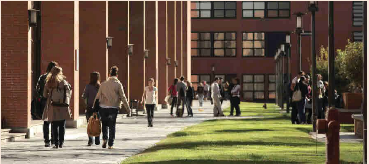
En la imagen, el campus de Getafe de la Universidad Carlos III.