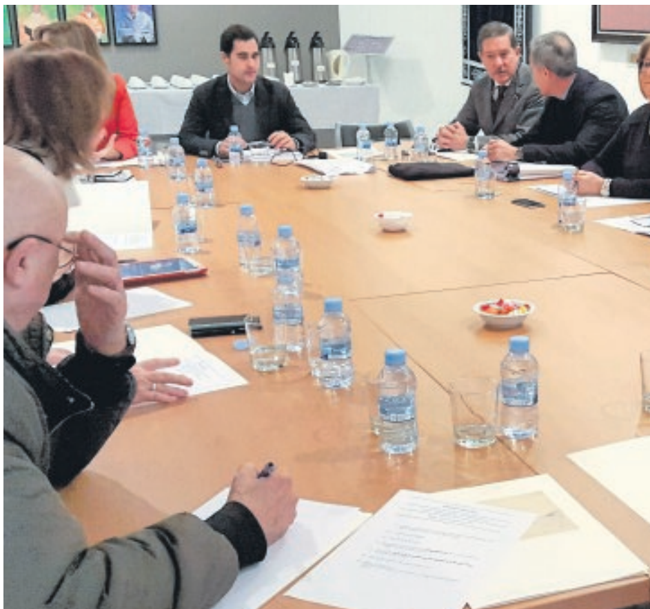
Reunión ayer del Consejo Social de la Universidad de Málaga