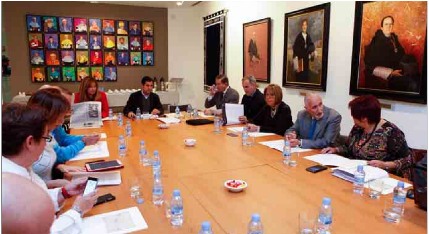
La rectora de la Universidad de Málaga (UMA), tercera por la derecha, en la reunión del consejo social celebrado ayer. JESÚS DOMÍNGUEZ