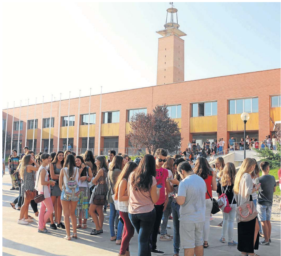
Estudiantes de la Universidad Pablo de Olavide.

La propuesta de la puesta en marcha de este doble grado será elevada a la Consejería de Economía y Conocimiento de la Junta de Andalucía para su aprobación, junto