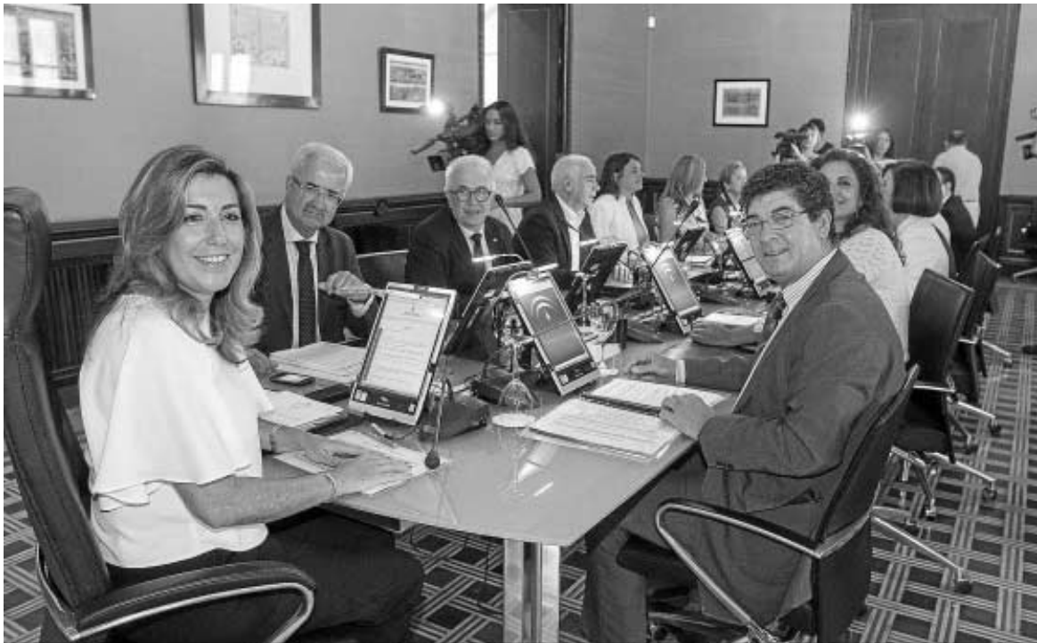
Reunión del Consejo de Gobierno de la Junta de Andalucía.