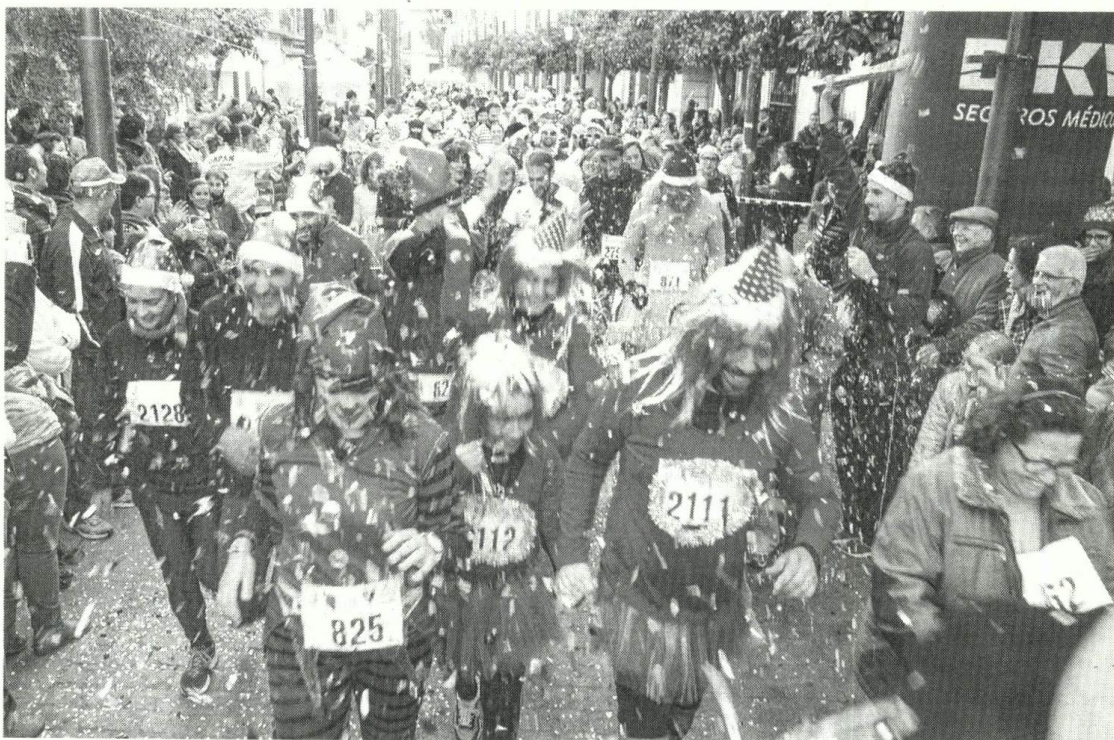
Los corredores, todos ellos disfrazados, fueron recibidos con confeti en la línea de meta.

La prueba solo exigía tres requisitos: correr 5,5 kilóme-