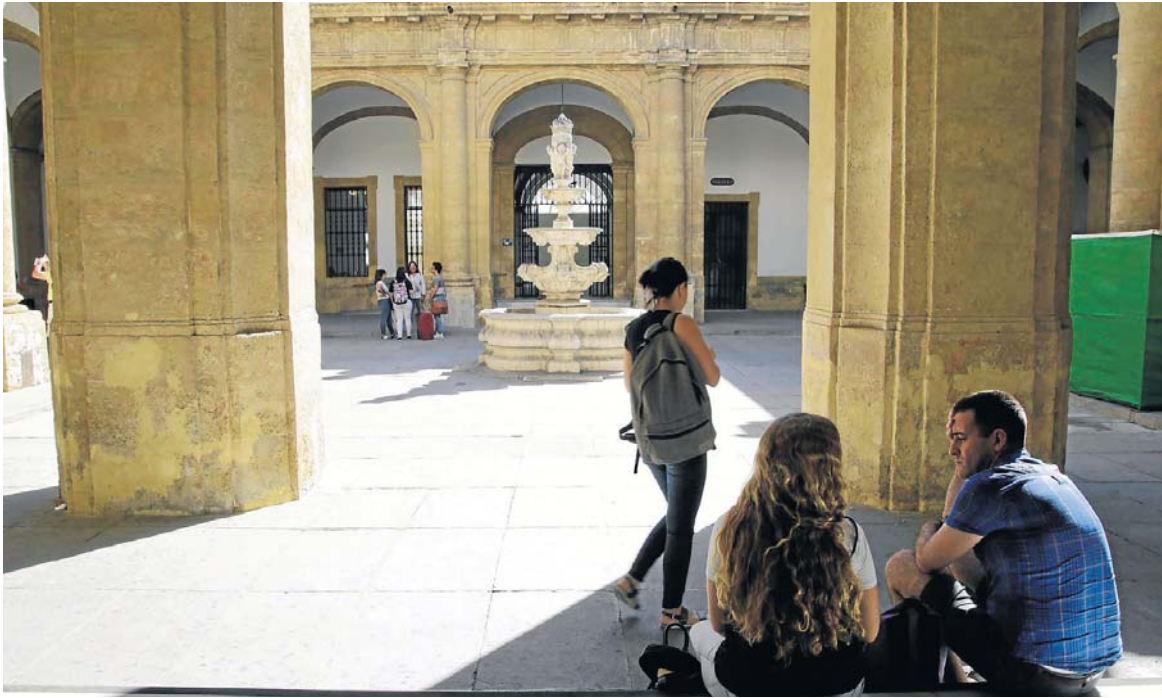
Uno de los patios de la Real Fábrica de Tabacos, sede del Rectorado de la Universidad de Sevilla. / José Luis Montero