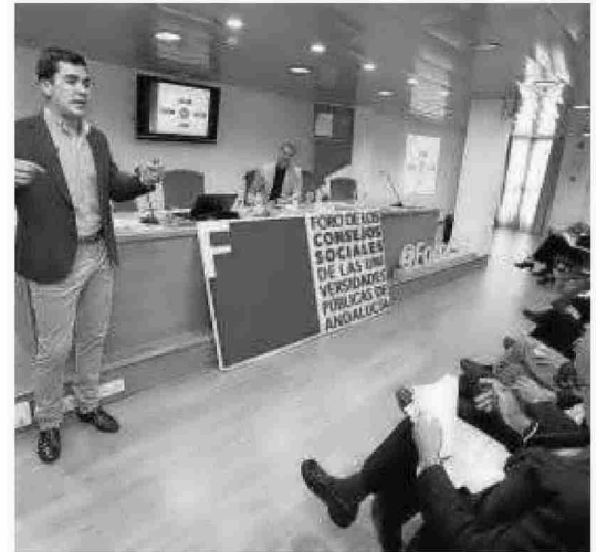
Imagen del foro celebrado en 2018.