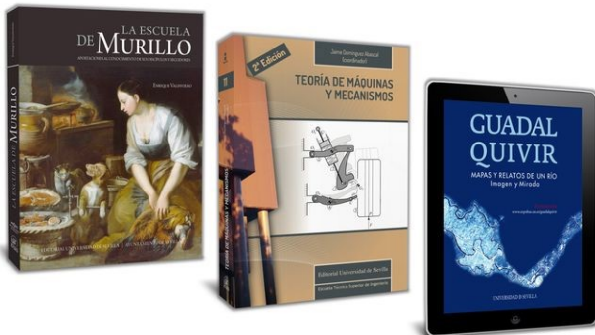
Los tres títulos editados por la US más vendidos de 2019.