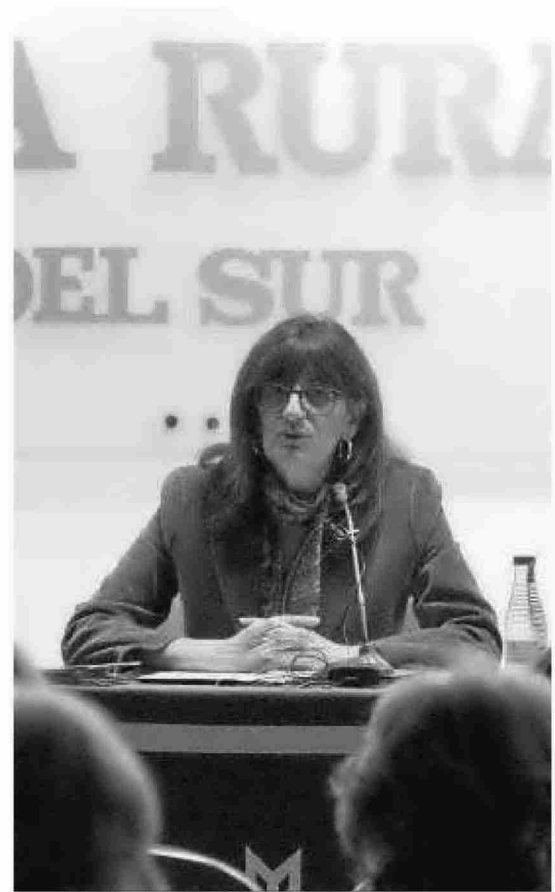
La rectora, en un momento de su conferencia.

Ante este problema, anunció la puesta en marcha del Proyecto Rumbo para captar a estudiantes de la provincia que tienen más fácil irse a Sevilla que a Huelva. Ante eso, indicó que "el panorama ha cambiado mucho, ya que antiguamente el talento se centraba en algunos puntos concretos pero ahora está muy repartido, pues el sistema universitario se ha hecho más complejo y disperso". De este modo,