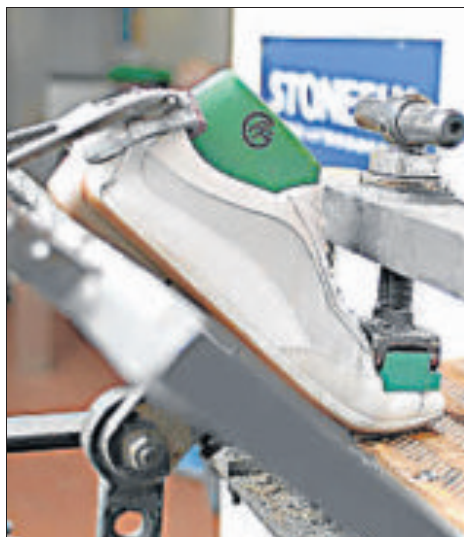
Calzado sometido a pruebas

Marcas como Stonefly, Mephisto o Skechers desarrollan tecnologías que atribuyen al zapato clásico, de uso diario, la comodidad y ventajas del calza-