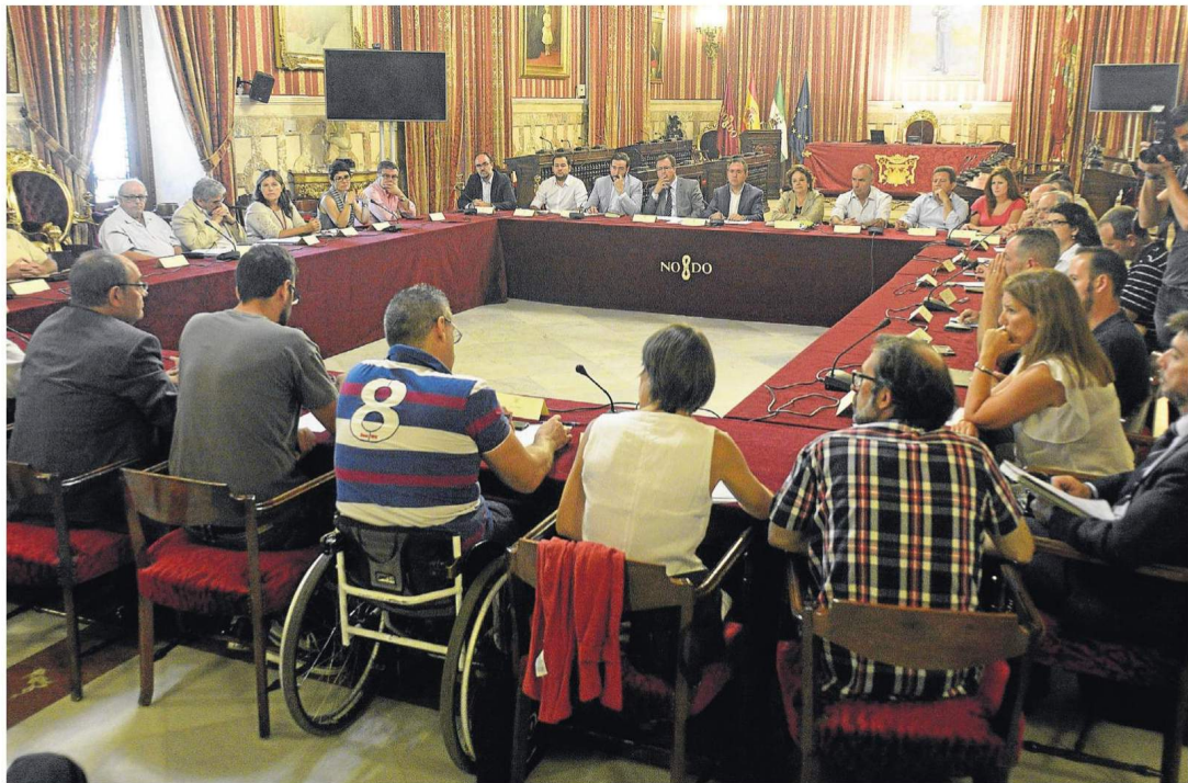
La Mesa de la Movilidad, que agrupa a colectivos y agentes sociales y partidos, se formó ayer y abordó el recorte de la zona azul.

«En vez de imponer como el anterior equipo de gobierno voy a escuchar a partidarios y detractores. Y a lo mejor hay que dejar la zona azul en algunas calles o reordenarla, pero me sentaré con los afectados. Además, en Bami, la solución pasa por abrir el aparcamiento subterráneo de 500 plazas de Rafael Salgado», expuso el alcalde, irritado con la forma actual de la zona azul: «Un horario de 8.00 a 22.00 horas no tiene más finalidad que la recauda-