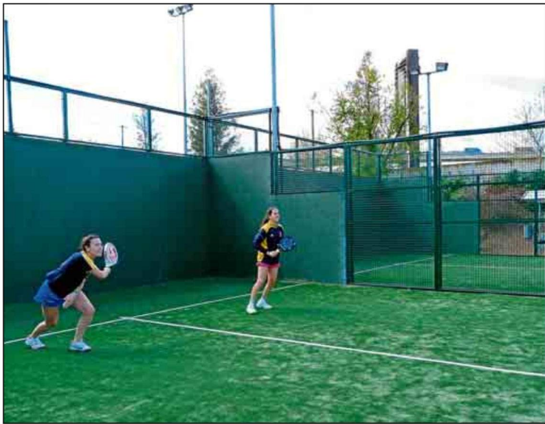
Los deportes de raqueta son de los más demandados por la comunidad universitaria.