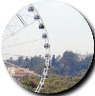
LA NORIA DEL RÍO Imitando a la de Londres, el Muelle de Nueva York iba a acoger una noria permanente con vistas privilegiadas