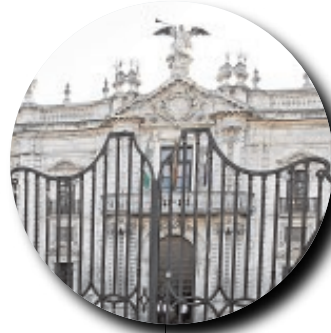
EL BELLAS ARTES La pinacoteca se iba a trasladar a la actual Universidad o se ampliaría al Palacio de Monsalves. Sigue esperando