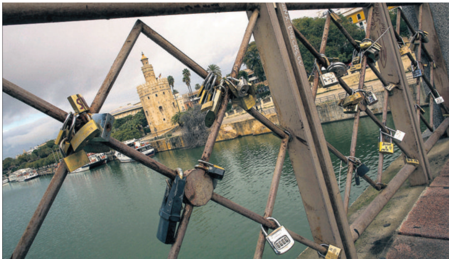
Candados en el puente de San Telmo en Sevilla. Al fondo, la torre del Oro.