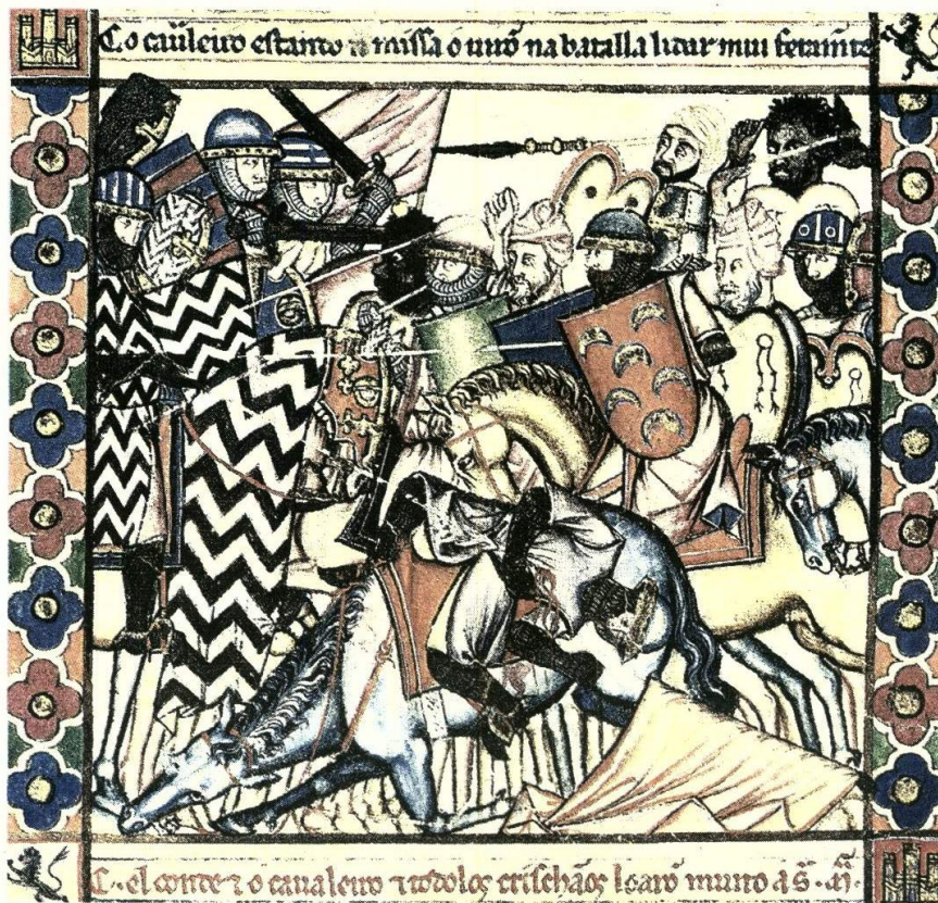
Miniatura de la batalla de Guadalete, en la que murió don Rodrigo