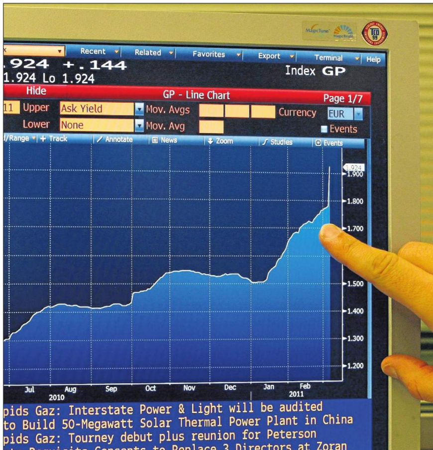
Imagen de un gráfico que muestra la evolución del Euríbor hipotecario a 12 meses.