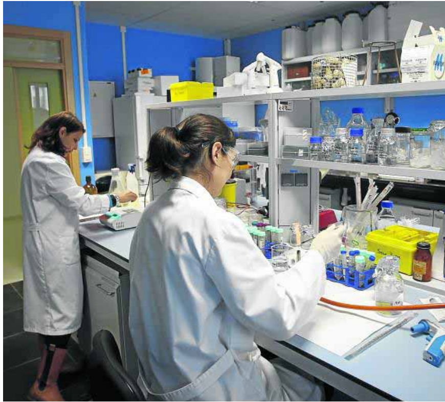
Investigadoras en uno de los laboratorios de la UGR, que cada vez cuentan con menos recursos.

En la media de financiación por proyectos se ha pasado de 148.457,53 euros en el año 2011 a 111.464,42 euros en 2012. Nada más y nada menos que 36.993 euros menos por proyecto. En definitiva, los datos de solicitudes, concedidos y tasa de éxito es