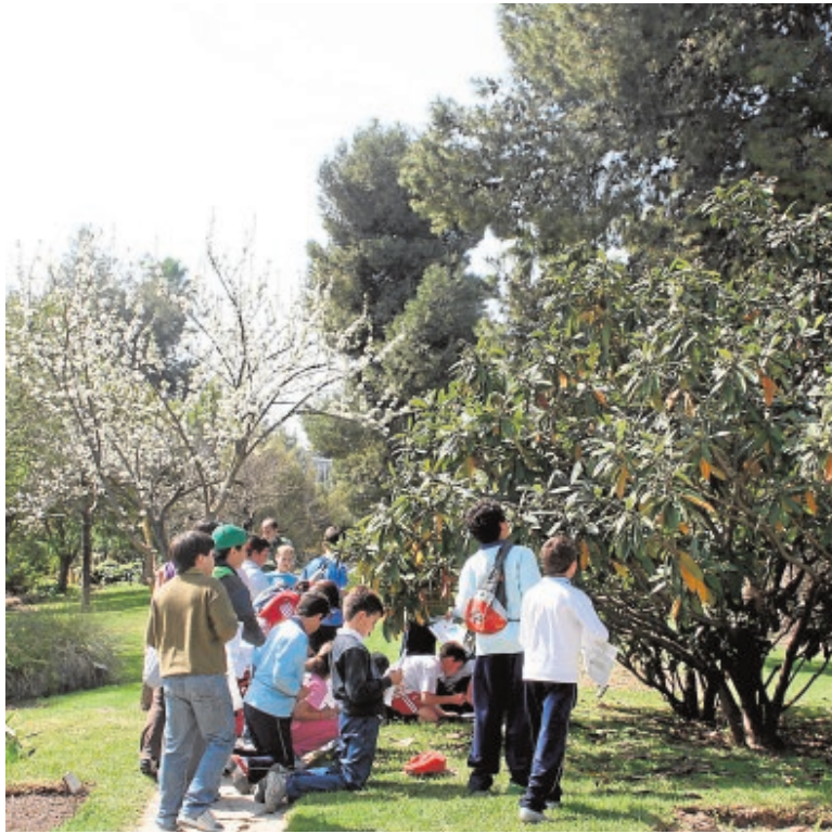
El jardín de El Arboreto plantea un didáctico y entretenido recorrido