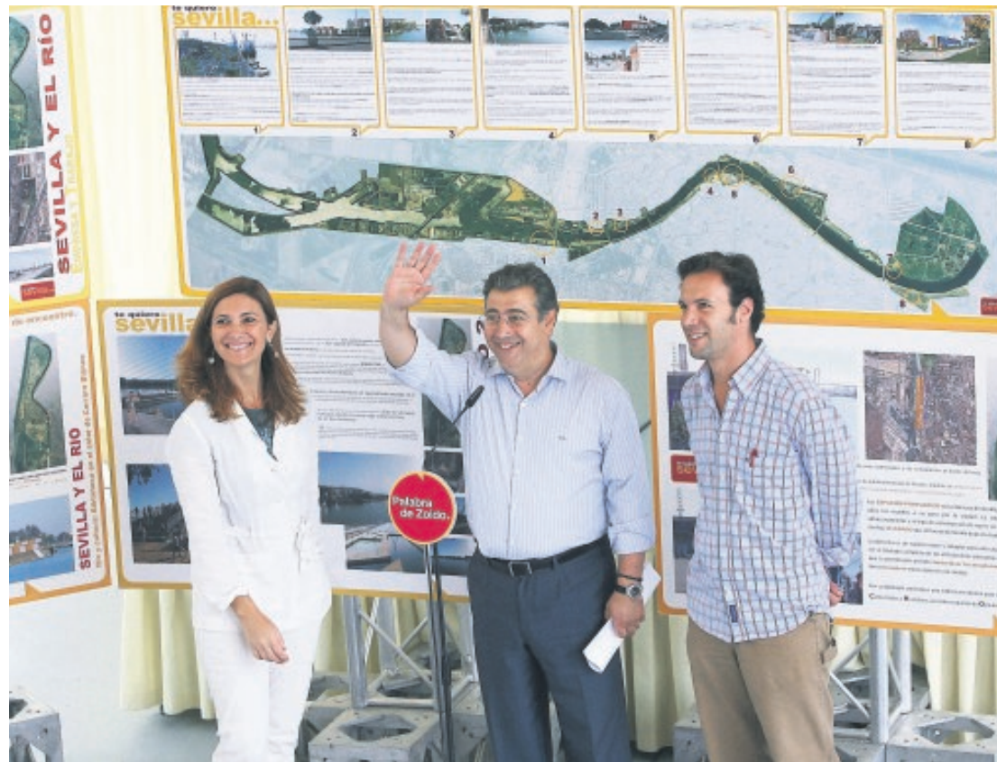
Juan Ignacio Zoido durante la presentación de las piscinas fluviales en 2007

tectónico», en el que se ubicarían unas 2.000 viviendas —900 de ellas de protección oficial—, con unas 2.000 plazas de aparcamiento previstas en unos 60.000 metros cuadrados bajo rasante. Vázquez Consuegra destacó el desarrollo urbanístico de la ciudad que supondría la intervención en la parcela de Heineken y dijo que el equipo de trabajo había comenzado a pergeñar la posible ordenación de la parcela, con vistas a resolver aspectos como el aprovechamiento de los espacios verdes o la localización de las viviendas, así como «intentar fundir la arquitectura contemporánea con la historia de Sevilla». Foster expresó que los arquitectos