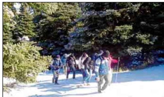
Imagen de los senderistas en una de las actividades por el medio natural.

esta ruta por el medio natural. La ruta comenzará en el Refugio de los Quejigales, desde el cual los senderistas subirán por la cañada del cuerno a través del pinsapar hasta llegar al puerto de los pilones. Si el día lo permite, se podrá disfrutar de unas magníficas vistas de la costa, Marruecos, Gibraltar, Sierra Nevada y varios pueblos de la sierra. El itinerario continuará por la meseta de los Quejigales hasta el nevero de Tolox, en el cual se tomará el desvío hasta el peñón de los enamorados, lugar donde se realizará un alto en el camino. Tras comer para reponer fuerzas, la ruta seguirá en dirección al puerto berlina para atravesar un precioso bosque mixto de pinos, algunos cedros y diversos matorrales que llevarán a la pista cercana a la Yunquera, donde se encuentra el final de la ruta.