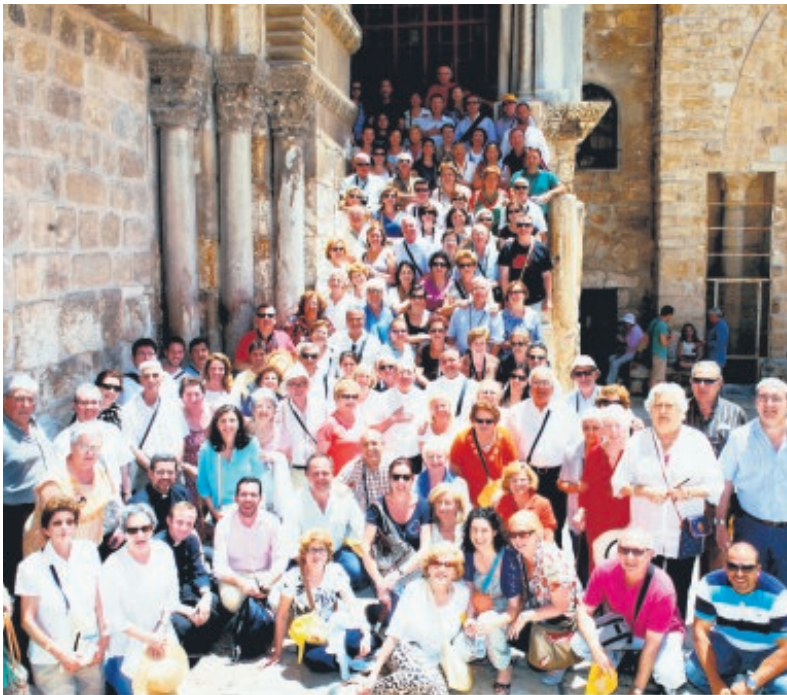
El arzobispo y los peregrinos en el viaje a Tierra Santa del año pasado