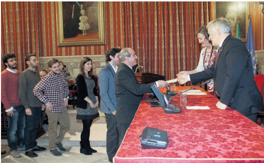
Miembros del grupo premiado, recogiendo ayer su reconocimiento