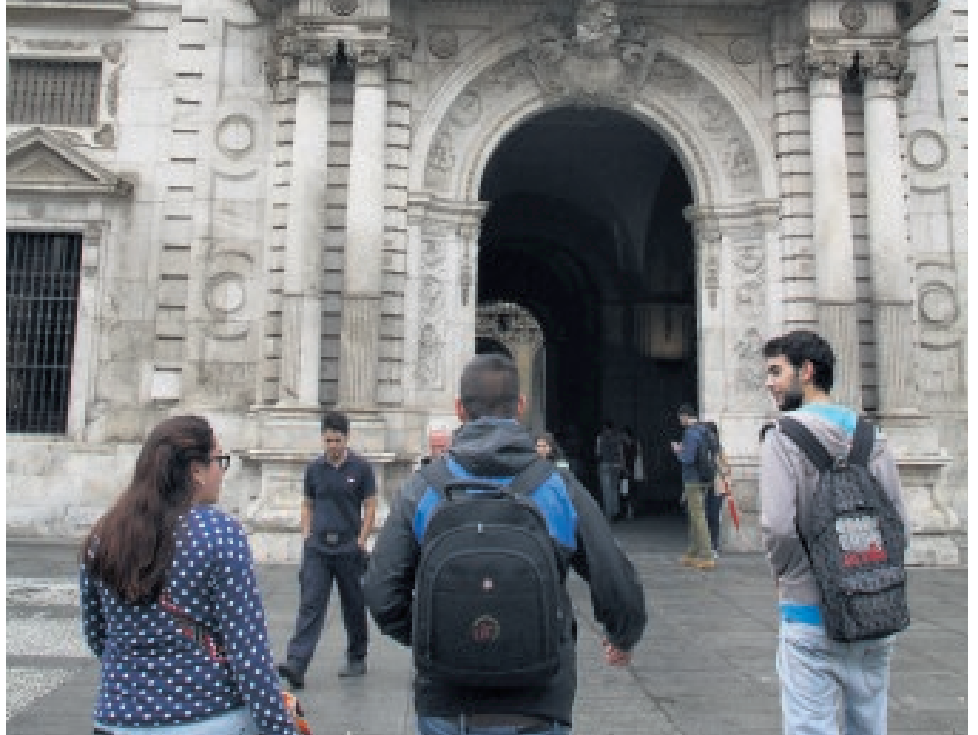
Estudiantes en la entrada del Rectorado de la Hispalense

Sea como fuere, los plazos para una posible convocatoria se han echado encima y ya no sería posible hacerla con los diez días de antelación preceptivos, teniendo en cuenta que se planteaba como fecha de inicio el 18 de enero para que coincidiera con el periodo de exámenes de enero-febrero. Y es que la intención de Adius de hacer una huelga contra los recortes y la situación laboral en la universidad no ha contado desde sus inicios con todo el apoyo esperado. Ni siquiera el referéndum que celebró para conocer la opinión del profesorado tuvo un respaldo mínimamente significativo. Tampoco lo ha en-