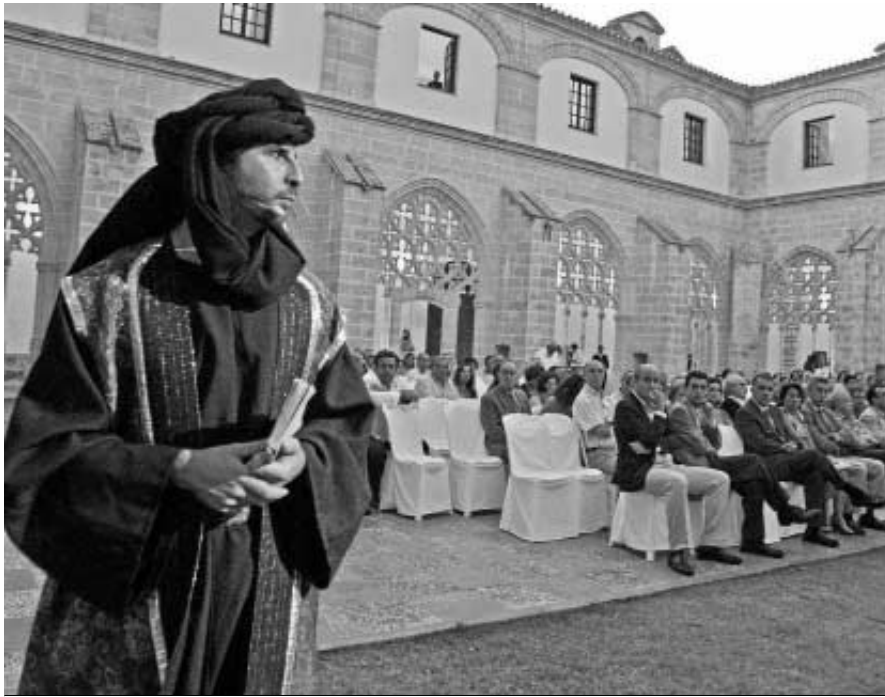
Imagen de la inauguración de los actos por el 750 aniversario de la incorporación de Jerez a la Corona.

El Congreso abordará, de la mano de voces autorizadas en la materia, el nacimiento de Jerez como ciudad castellana y ahondará en el análisis de su origen así de todos los elementos vertebradores tanto del 'ager' como de la 'civitas' jerezana, con el objetivo