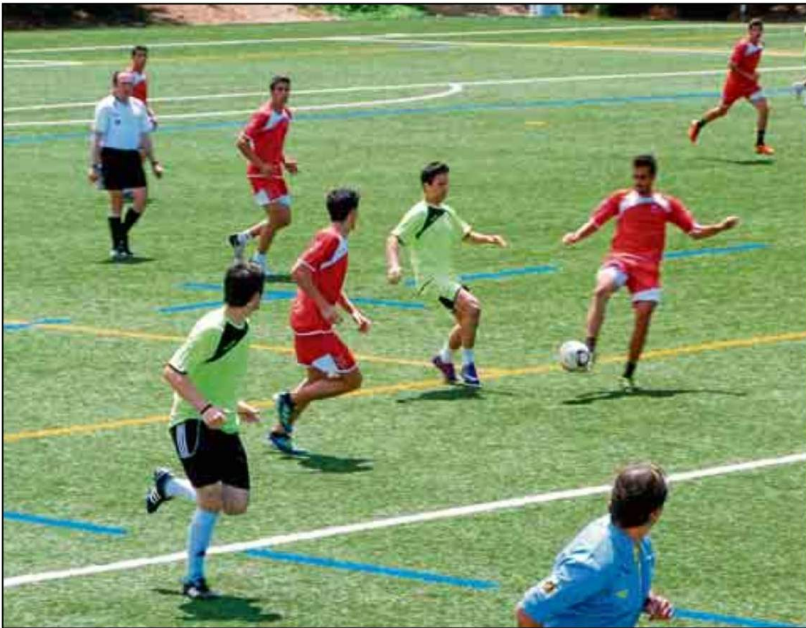
Se llevarán a cabo torneos en más de diez modalidades, entre ellas, fútbol y fútbol sala.