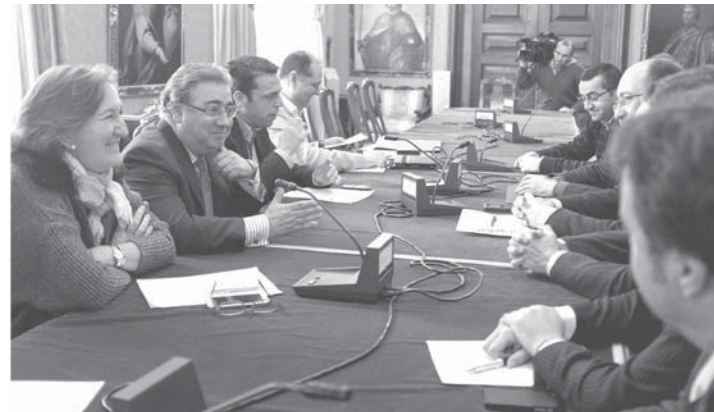
Un momento de la reunión de la comisión organizadora de la Bienal de Flamenco de Sevilla. AVTQ

nista Dorantes estrenará Flamenco a cordes , junto al contrabajista Renaud García-Fons; Isabel Bayón, reciente Premio Nacional de Danza, presentará su espectáculo Caprichos del tiempo , mientras que Jesús Méndez y Antonio Reyes estrenarán el espectáculo Cantaores .