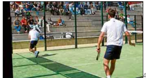
Las inscripciones se podrán formalizar a través de la Oficina Virtual.

web, los abonados podrán hacerlo mediante la Oficina Virtual, en el apartado de Cursos y Actividades, utilizando su DNI o documento alternativo y la clave del sistema de reservas que habrá obtenido en el SADUS o en la propia web del servicio previamente. En este sentido, los abonados podrán efectuar los pagos por tres vías diferentes: mediante tarjeta de crédito, por domiciliación bancaria o a través del Saldo Cliente, que también podrá ser recargado en la propia web. Por otro lado, en la misma Oficina Virtual se podrá consultar la disponibilidad de plazas, horarios y formas de pago, entre otros datos, además de realizar la inscripción.