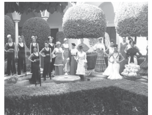
Un momento de la presentación de la XX edición de Simof. VIVA

Fibes y la Agencia Doble Erre organizan esta edición con el objetivo de servir de revulsivo para el desarrollo de la moda flamenca, que engloba a un gran abanico de pequeñas, medianas y grandes empresas, en su mayoría de Andalucía. Como novedad, se entregará el premio honorífico Flamenco en la Piel a la duquesa de Alba por su implicación desde sus inicios.