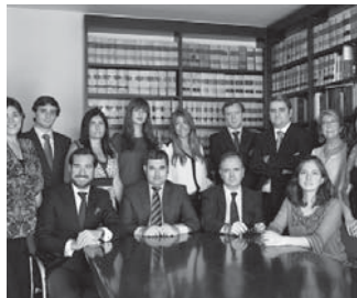
El equipo de Fernández-Palacios Abogados.

El despacho ha llevado casos con mucha repercusión mediática, como el de las camisetas de Madonna con la cara de la Macarena