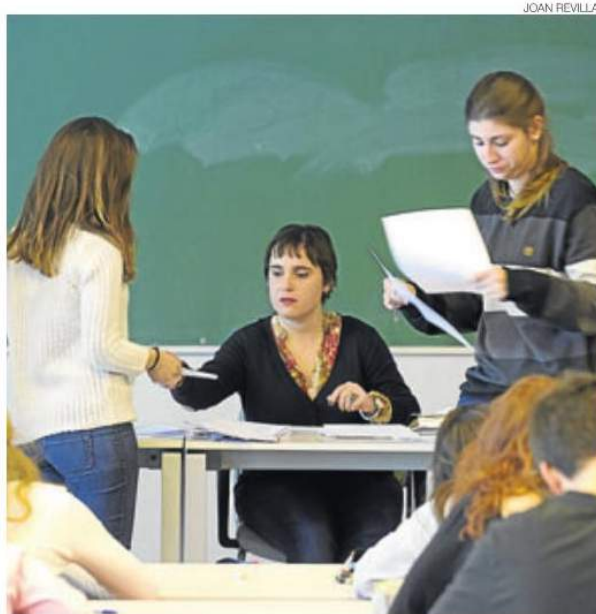
Varios alumnos universitarios entregan sus exámenes.