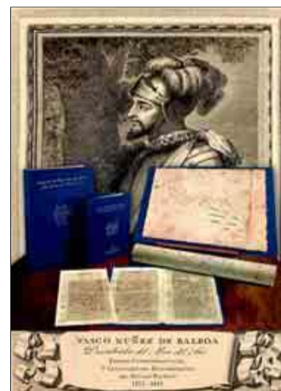
Los libros que Rajoy regaló a Obama.