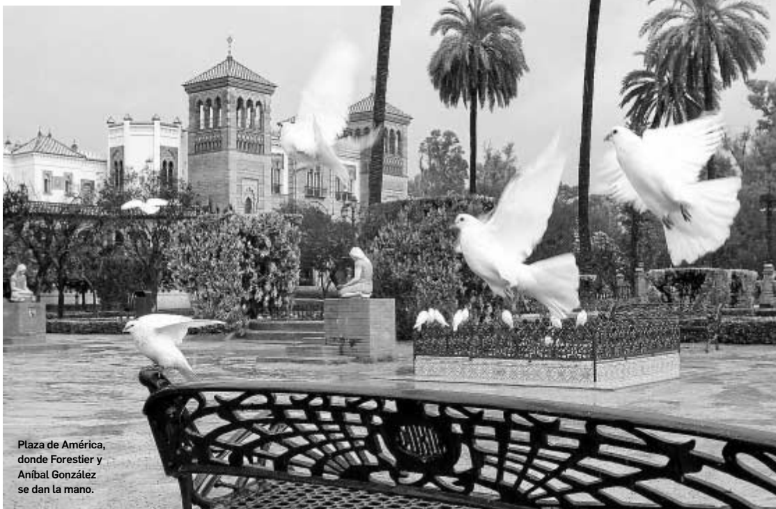
Plaza de América, donde Forestier y Aníbal González se dan la mano.