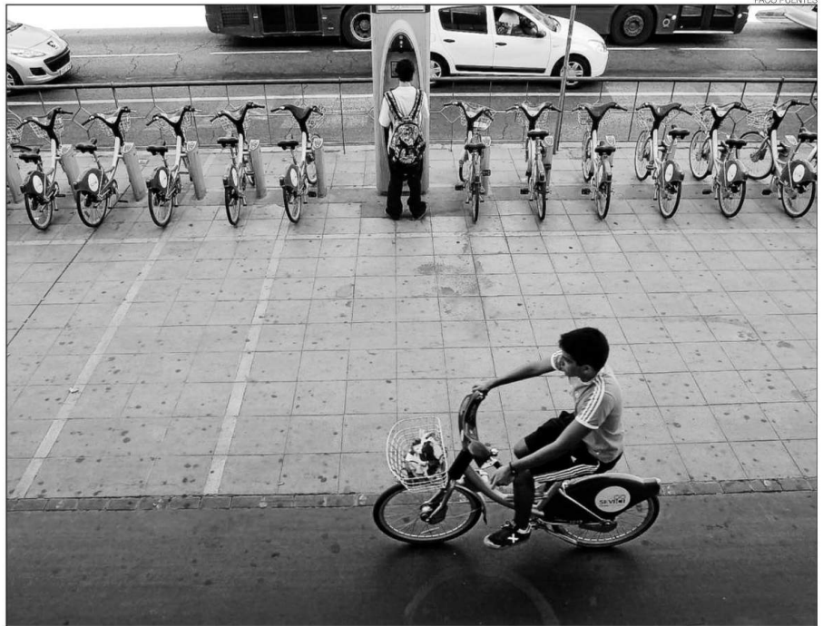
► Un usuario de Sevici circula por el carril bici existente en la estación de autobuses de Plaza de Armas.

"Sevilla es el mejor aval con el que contamos para explicar el éxito de la promoción del uso de la bicicleta en el resto de ciudades andaluzas", insis-