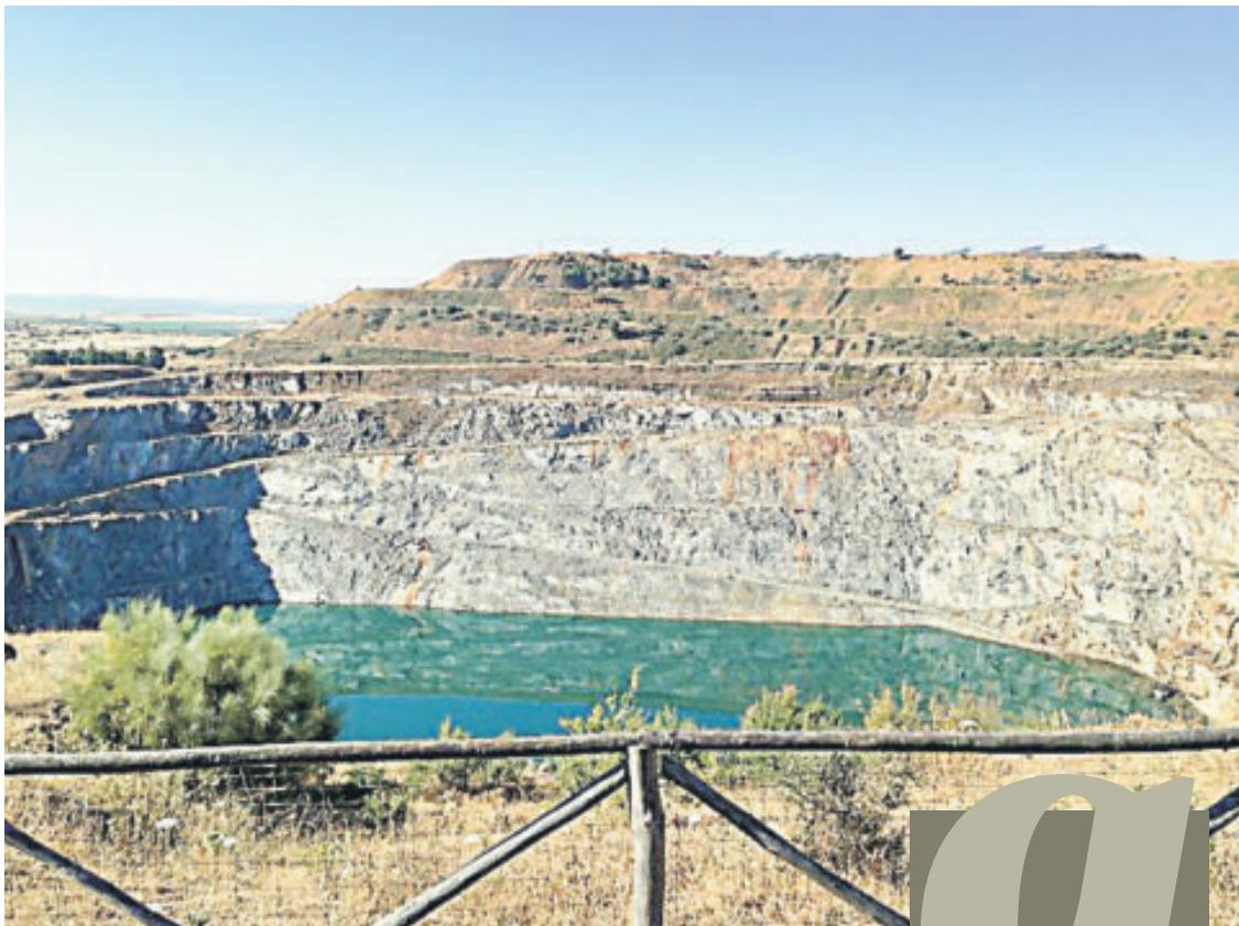
Corta de la mina de Aznalcóllar, donde volverá la actividad