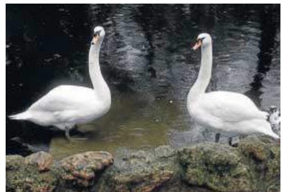
El estanque de los patos, una de los enclaves más antiguos del parque.