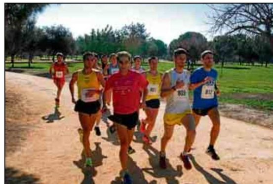
Universitarios participantes en las pruebas de campo a través.

Cabe recordar a los participantes que, debido a las condiciones climatológicas que se esperan, se hace más que aconsejable venir provisto de zapatillas con clavos. Toda la información, clasificaciones, vídeos y fotografías de la competición se publicarán en la web del SADUS (www.sadus.us.es); además puede consultar la información del circuito en www.crossinternacionaldeitalica.es.