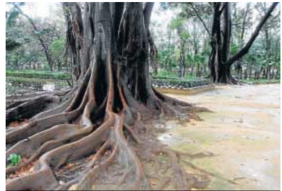
Uno de los árboles de la época de los Montpensier.