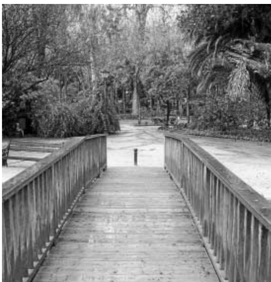
Puente que sirve para cruzar el estanque de los patos.