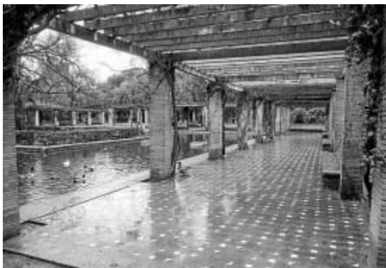
Estanque de los lotos, con las típicas enredaderas en las pérgolas.