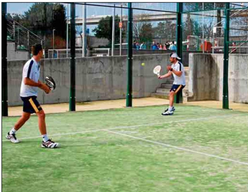
La petición de reserva podrá hacerse por dos vías (Oficina de Atención al Cliente y Oficina Virtual).