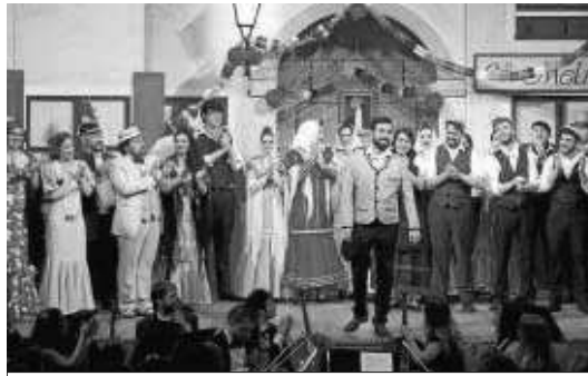
La Compañía Sevillana de Zarzuela durante una actuación.

● La Compañía Sevillana de Zarzuela cierra su X Aniversario con 'El año pasado por agua'