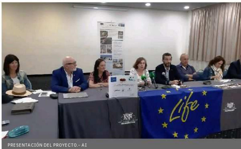
PRESENTACIÓN DEL PROYECTO.- AI

El proyecto consiste en su conservación y también en la recuperación de la especie mediante el transporte de especímenes desde Melilla hasta el área receptora