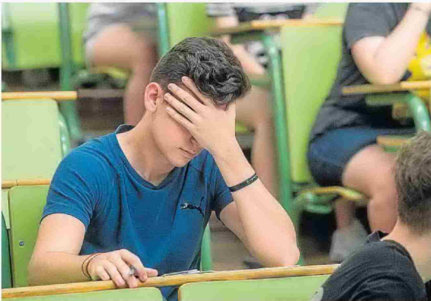
Un estudiante espera el comienzo de la Selectividad en la Universidad de Zaragoza.