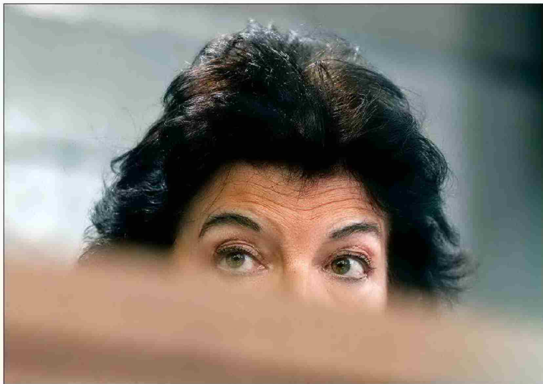
Isabel Celaá, ministra de Educación en funciones, durante la rueda de prensa tras un Congreso de Ministros. JAVI MARTÍNEZ