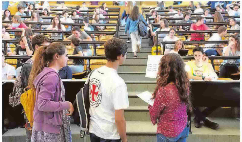
Jóvenes se presentan a la Selectividad en la Facultad de Odontología de la Universidad Complutense

Inequidad «Una prueba única crea más desigualdades que el sistema actual», advierte el presidente de los rectores