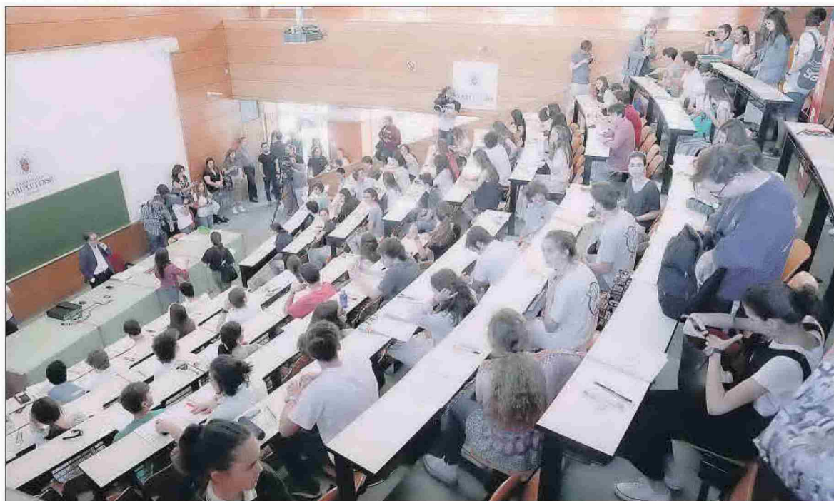
Más de 33.000 alumnos afrontan las pruebas de acceso a la Universidad en Madrid.