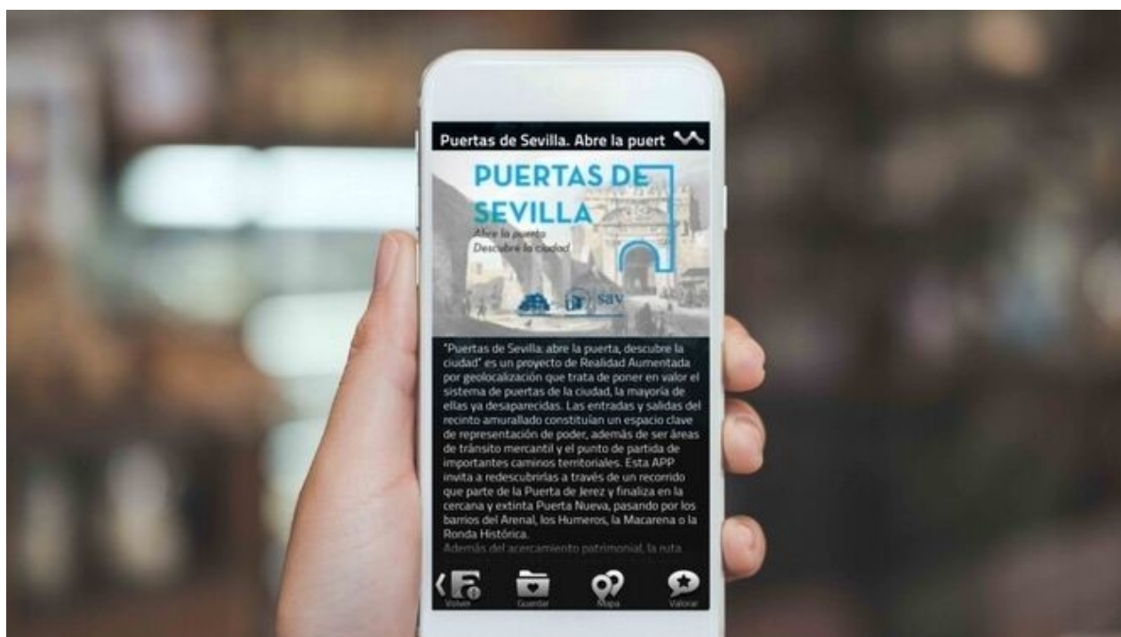
Visionado de la aplicación desde la pantalla de un móvil.