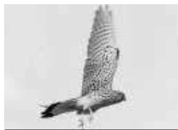
Ejemplar de cernícalo primilla.

Por primera vez, este año se ha realizado un censo, pendiente de concluir, desde las cubiertas de la Catedral, gracias a las facilidades brindadas por el Cabildo Catedralicio, consciente de la importancia