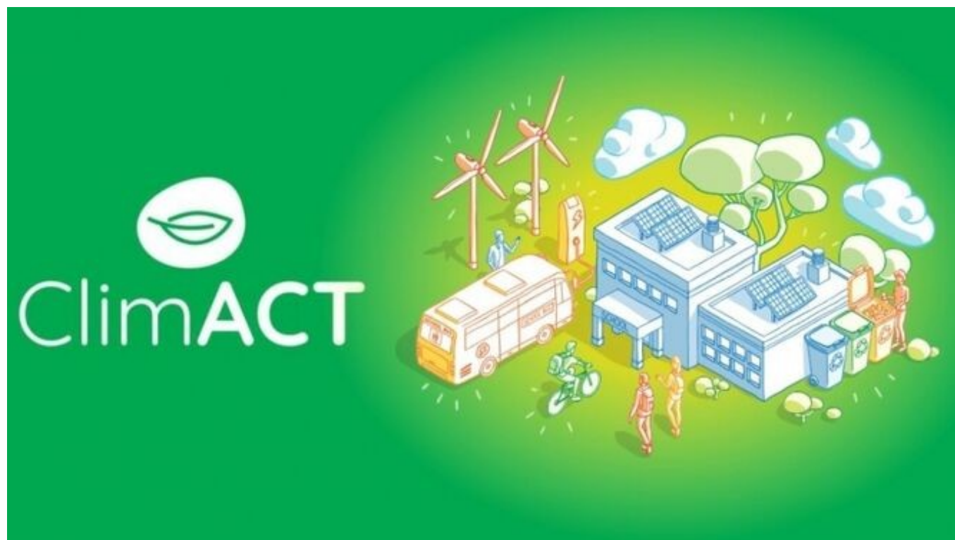
Cartel del proyecto ClimACT.