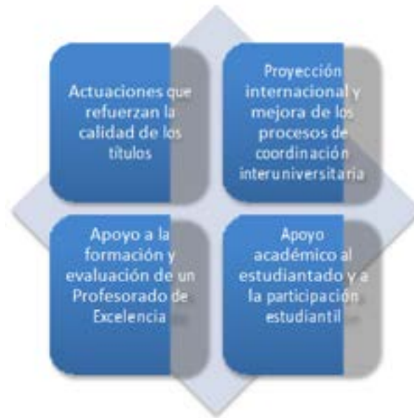
Líneas estratégicas del III Plan propio de Docencia (2017-2020)