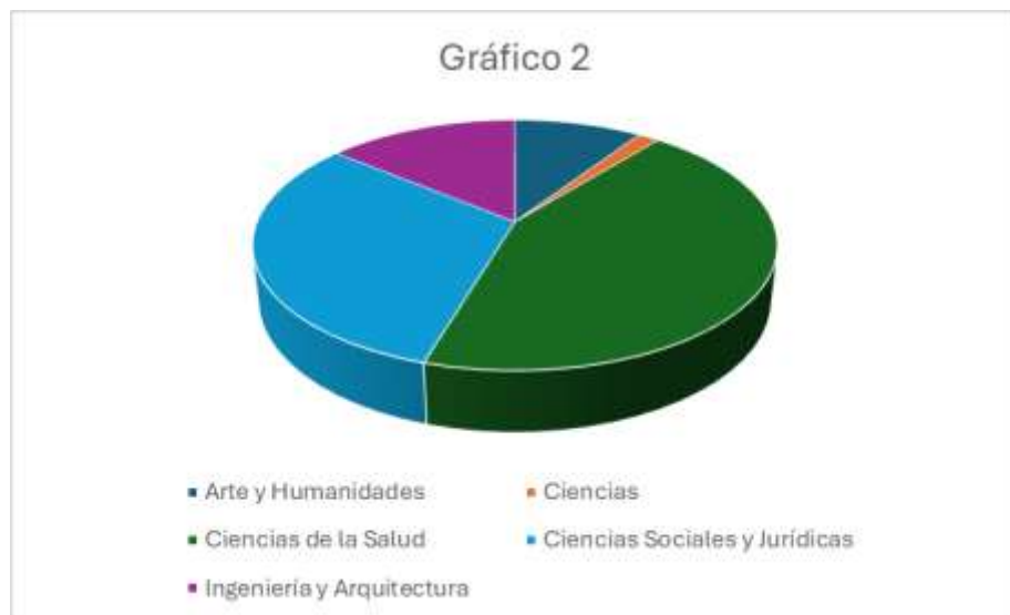
Gráfico 2. Oferta para el curso 2024/2025 según área de conocimiento