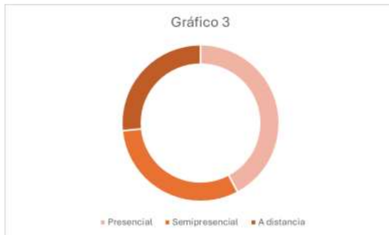
Gráfico 3. Oferta para el curso 2024/2025 según modalidad de impartición